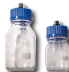
Pots de purge optionnels