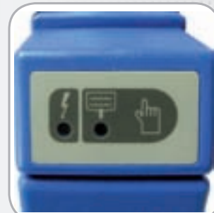
Voyants de contrôle et test de purge manuel