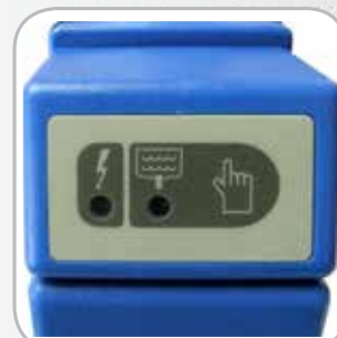
Voyants de contrôle et test de purge manuel