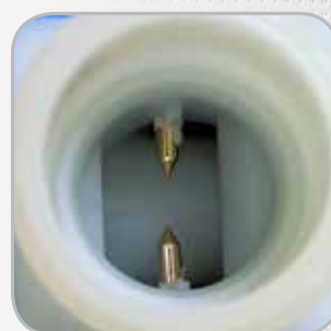
Contacts traités anti-corrosion