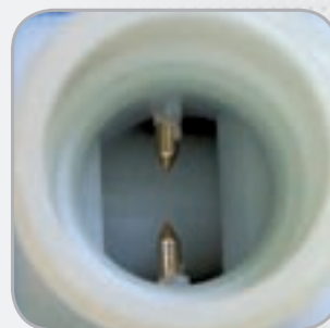
Contacts traités anti-corrosion