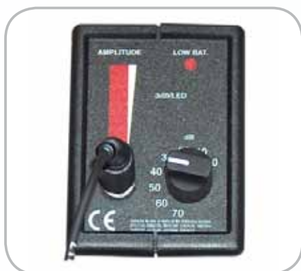
Indicateur visuel à LED Témoin de batterie et réglage de sensibilité