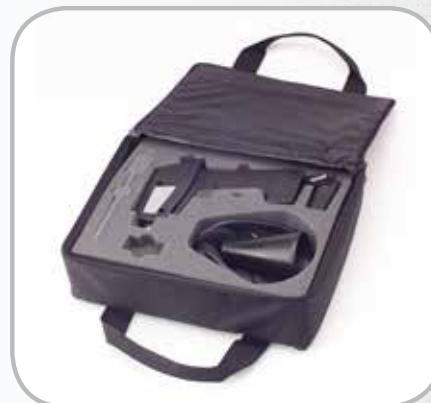
Fourni avec mallette de transport anti-choc comprenant tous les accessoires nécessaires.