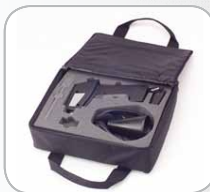
Fourni avec mallette de transport anti-choc comprenant tous les accessoires nécessaires.