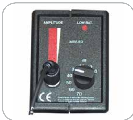
Indicateur visuel à LED Témoin de batterie et réglage de sensibilité