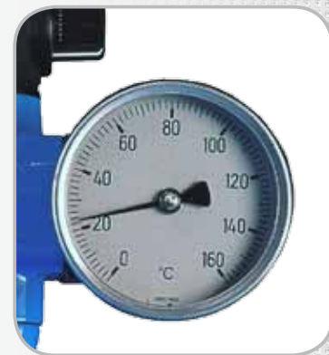
Thermomètre de sortie (Version TH uniquement)