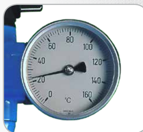
Thermomètre de sortie (Version TH uniquement)

Élévation de température maximale selon modèle et débit d'air comprimé