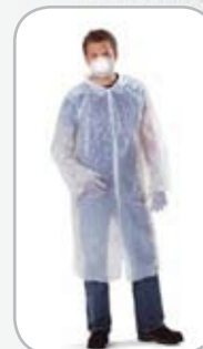
Ensemble de protection individuel fourni avec chaque kit de recharge