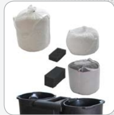
Éléments filtrants conçus pour un remplacement simple et sans effort.