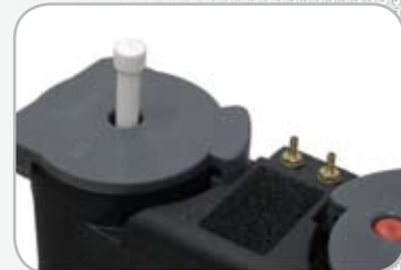
Indicateurs de saturation et de surcharge

* Nécessite un adsorbant spécifique et une réduction du débit traité. Nous consulter pour ces applications.