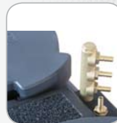
Adaptateur optionnel multi-entrées