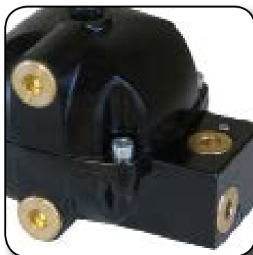
3 raccords d'entrée