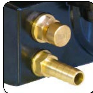
Bouton de test