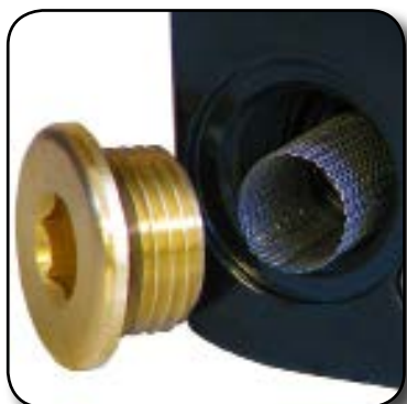
Crépine de protection