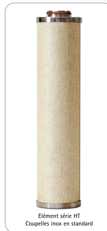
Elément série HT Couppelles inox en standard