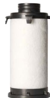
Elément filtrant grade EF