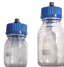
Pots de purge optionnels