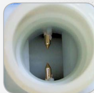
Contacts traités anti-corrosion