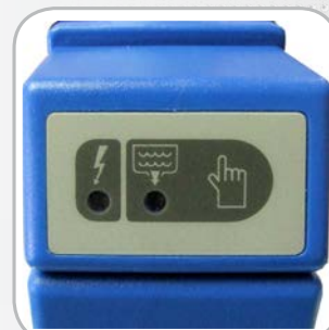
Voyants de contrôle et test de purge manuel