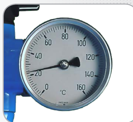
Thermomètre de sortie (Version TH uniquement)

Élévation de température maximale selon modèle et débit d'air comprimé