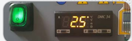
Affichage digital du Point de rosée (tous modèles)