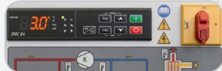
Contrôleur multi-fonctions DMC 24 (ACT 1130 et +)