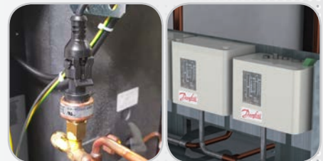
Transducteur de pression