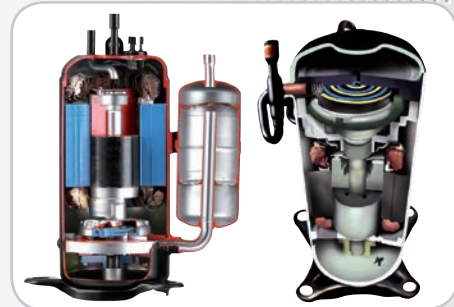
Compresseurs rotatifs et scroll dernière génération