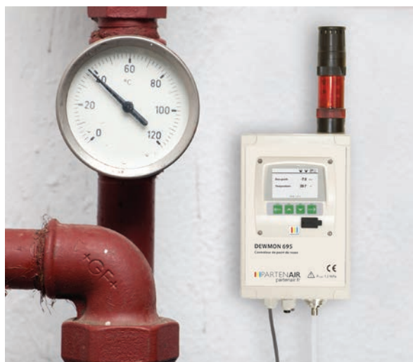
DEWMON 695.300 avec alarme optionnelle visuelle et sonore