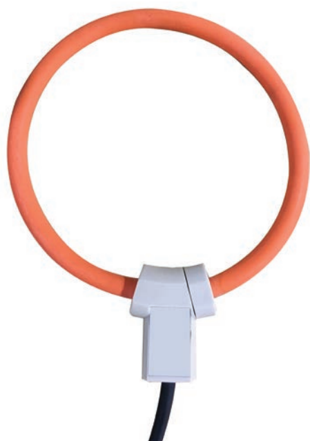
Capteur de courant MPU 0185 (Boucle de Rogowski)

La boucle ampèremétrique PARTENAIR est un capteur de courant alternatif RMS composé d'une boucle de mesure de courant flexible , d'un enroulement de Rogowski et d'un transducteur numérique compact. Cette technique permet de mesurer des courants allant jusqu'à 3 000 A - courant alternatif - dans un conducteur fermé.