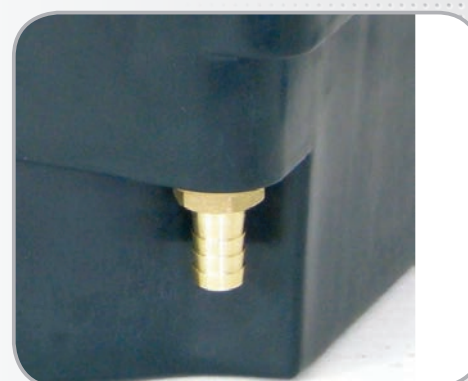
Raccords pour tube fournis.