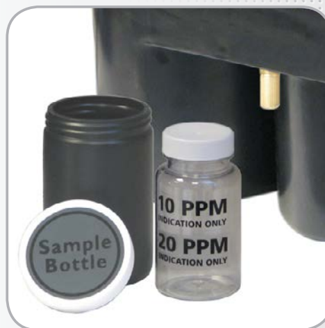
Kit de prélèvement et test de turbidité