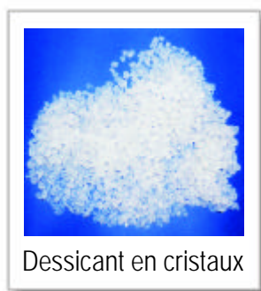
Dessiccant en cristaux

2 technologies sont majoritairement employées pour régénérer les sècheurs par adsorption. La régénération par balayage d'air sec "Pressure swing" et la régénération par apport calorifique "thermal swing", nous y reviendrons dans un prochain numéro.