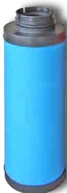
Série HF Déshuileur 0,01 ppm