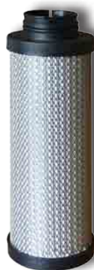
Série CF Charbon actif