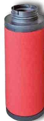
Série DF Post-Filtre 1 μ