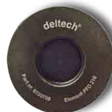
Coupelle inférieure sérigraphiée DELTECH avec référence et modèle.