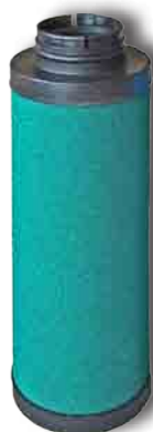
Série PF Préfiltre 1 μ