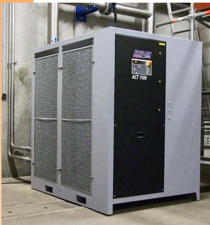
Sécheur ACT 1100 - Débit 6620 m 3 /h

Nous l'avions annoncé dans une précédente édition, les modèles ACT 180 et supérieurs ont fait l'objet d'une évolution de gamme qui rend ces modèles encore plus attractifs sur le marché très disputé des sécheurs par réfrigération.