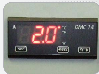
Contrôle du point de rosée (PCD 10 à 120)